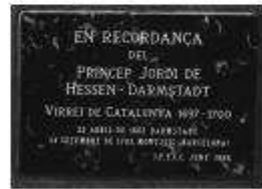
El príncep Jordi de Hessen-Darmstadt amb un moment de la seva estada a l'edifici dels Jaques, a Tòrrida.