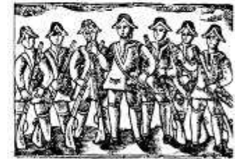
El Consell de la Generalitat de Catalunya, organitzat en consells per ciutat. La imatge és d'alguns dels consellers de la Generalitat. És a la mort del Conseller en Cap, que és el cap general.