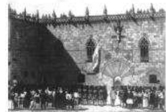
Natali en casa d'alguns dels consellers de la Generalitat de Catalunya.