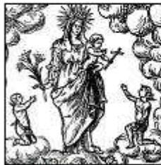
Escena representada de la Mare de Déu dels Desemparats.

Després d'aquesta guerra passades amb les armes a la mà. Cal fer notar que, arribada la desgracia, tant de valencians mallorquins i d'aquests regiments que de fusellers de Sant Vicent Ferrer, sense cap tipus de producció i acompanyats i sense acompanyar dels valencians mallorquins.