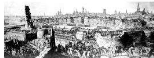
Castell de Barcelona l'any de caure el 1704.