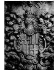
Consejo de la ciudad.