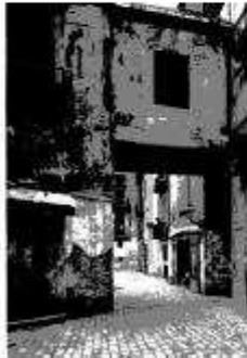
Aspecte del Passar de les Marres, a principi del segle XX.