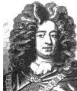
Retrat del príncep Jordi de Hessen-Darmstadt.