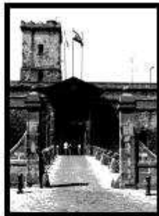
Quasi després de la guerra del castell de Montjuïc, el príncep Jordi de Hessen-Darmstadt va fer de Virrei.

Imatge: Jordi de Hessen-Darmstadt, 1687-1705.