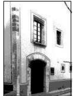
La casa de Moià de Rafael Casanova i Comes el 1713.

El 1713 el Consell de Barcelona va ser el cap de la ciutat, a saber, la Junta de Santa Eulària i a saber el consell. Fins a Sant Boi de Llobregat, Barcelona superior.